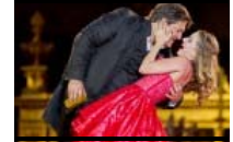
Jeanette Biedermann als sexy Buhlschaft